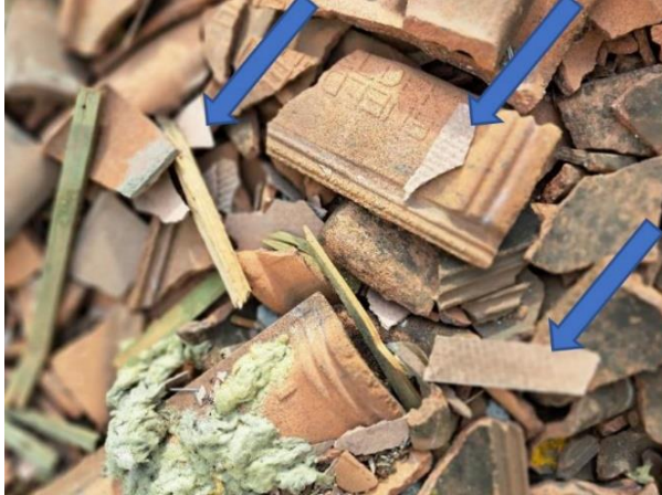
Restanten van onderdakplaten tussen dakpannen

Bij een ongunstig advies volgt, naast de automatische e-mail, ook bijkomend contact met de betrokken partijen. Nadien wordt een tweede e-mail verstuurd met ofwel: