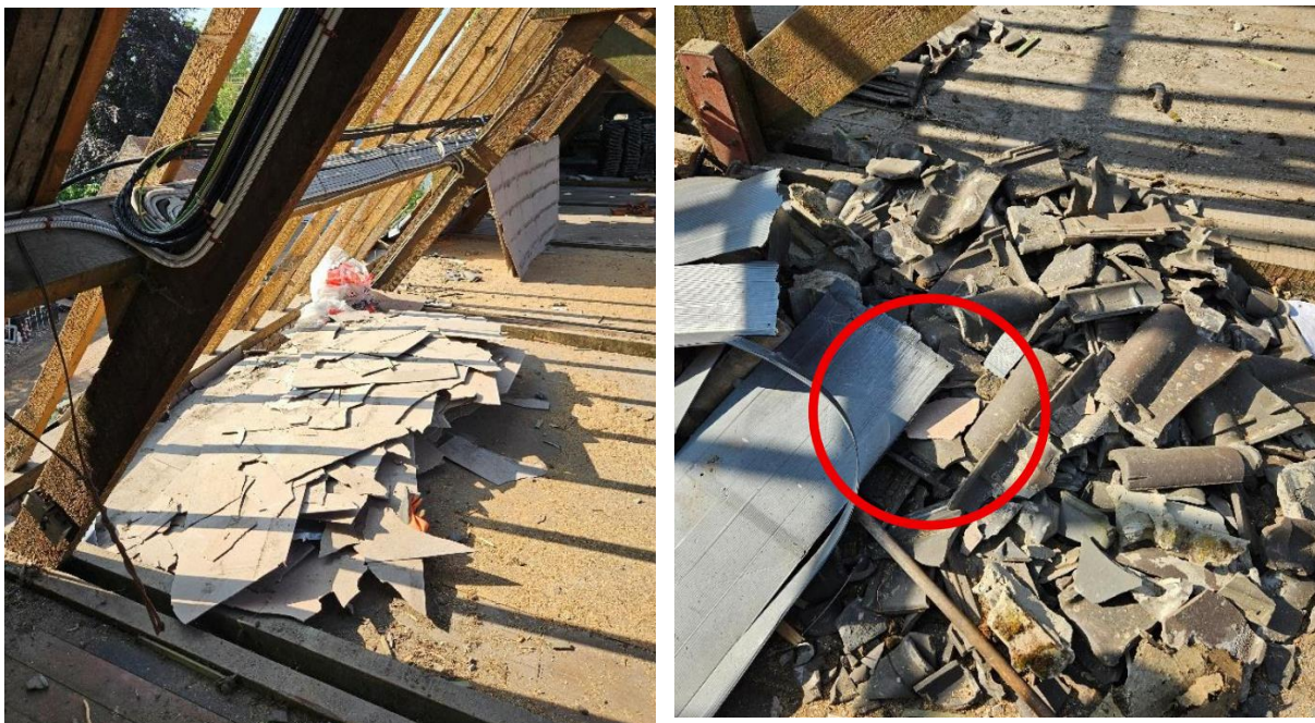
Onzorgvuldige asbestverwijdering: het breken in kleine fragmenten van onderdakplaten + restcontaminatie

Bij een ongunstig advies evalueert Tracimat samen met de sloopdeskundige en de uitvoerder van de sloopwerken of corrigerende maatregelen mogelijk zijn om de traceerbaarheidsprocedure alsnog verder te zetten. Indien dit niet meer mogelijk blijkt, wordt de traceerbaarheidsprocedure stopgezet en kan er geen sloopattest worden afgeleverd voor de werf.