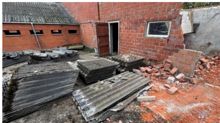
Onzorgvuldige opslag van verwijderde asbesttoepassingen